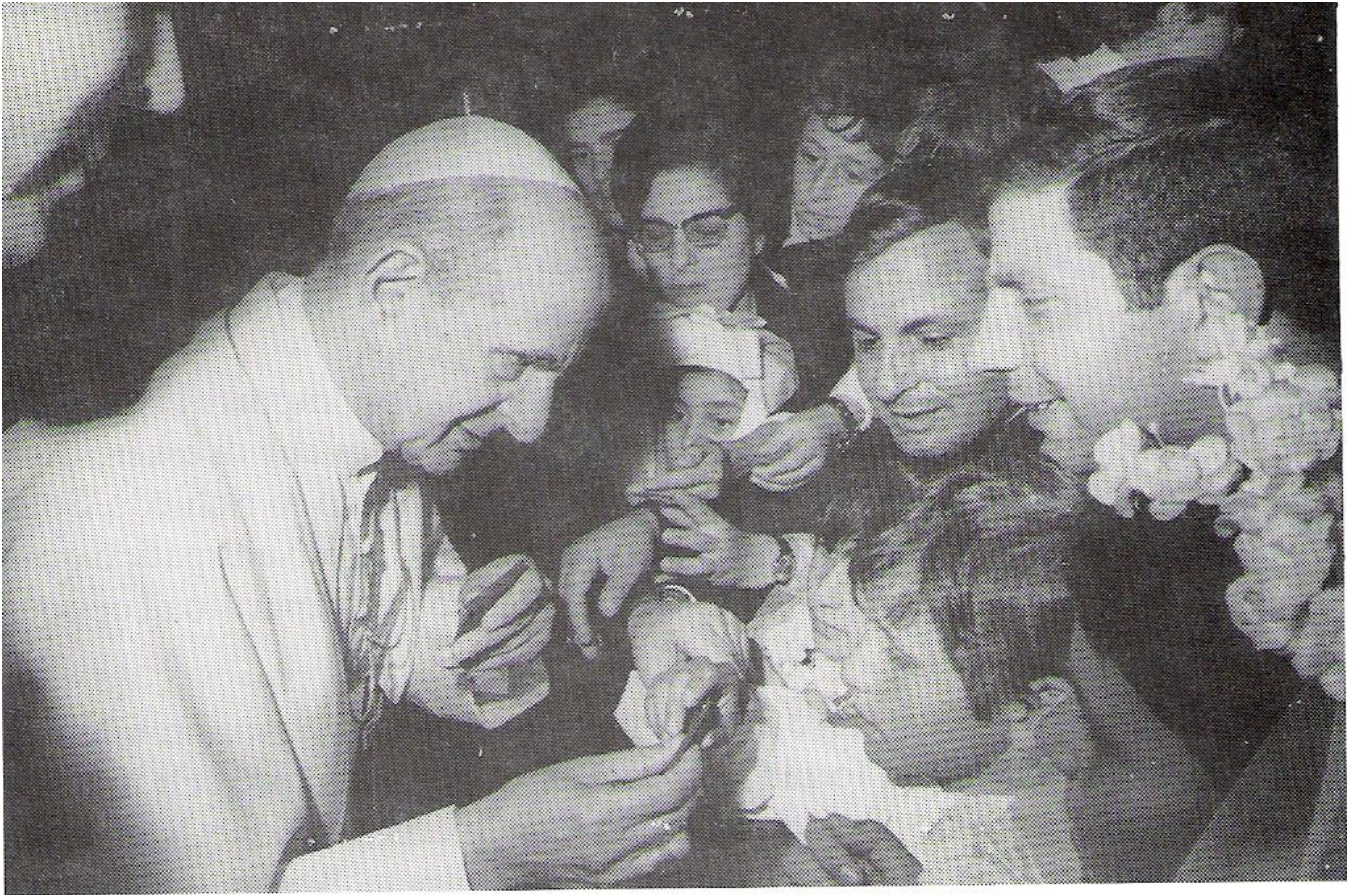
Papa Paolo VI, il Papa della nascita della parrocchia, incontra i bimbi della Prima Comunione della parrocchia