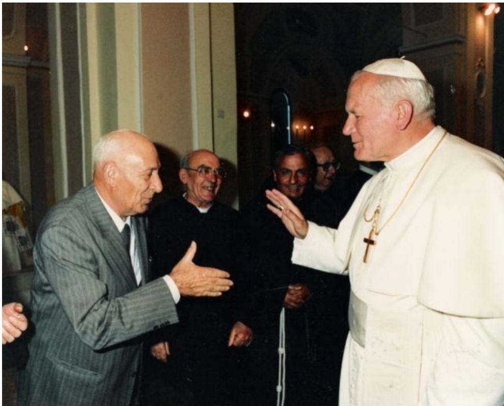
Don Potito Clemente, tra le due mani, e il Papa Giovanni Paolo II nella Cattedrale di Ascoli Satriano