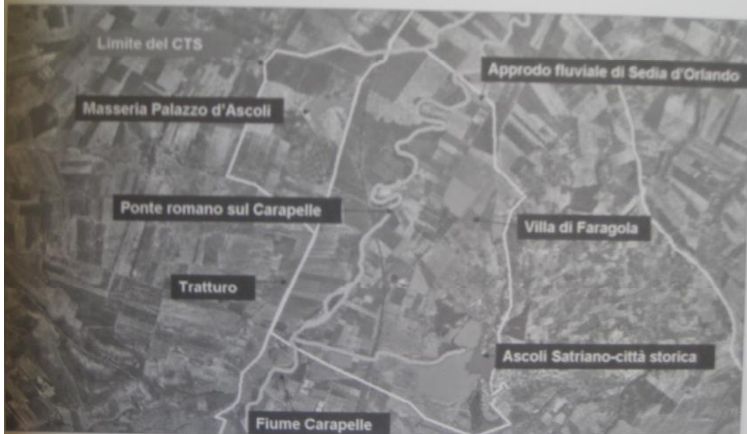
11. - Il Contesto Topografico Stratificato individuato nella Valle del Carapelle (Carta dei Beni Culturali, PPTR Puglia).