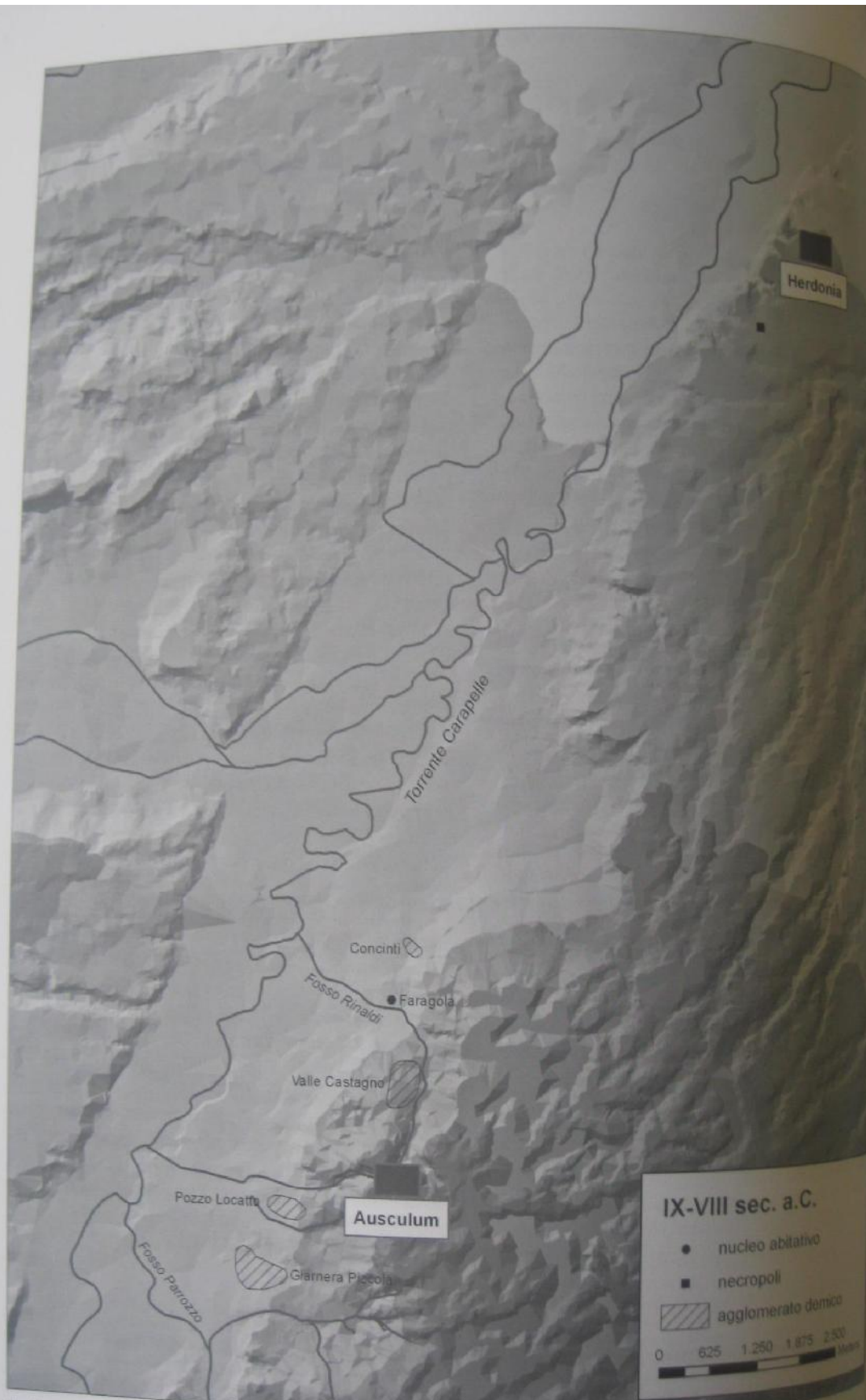
4. - Assetto insediativo della valle del Carapelle tra IX ed VIII secolo a.C.

sorsero invece Giarnera Piccola Il processo del VI secolo a vesti con la me presenti nella mensionale, m nella più artic di occupazione tivazione delle l'intensificazio lungo raggio (i redi sepolcrali deperibile per tra con tetto p naci per la pro attestazione di che del Golfo c madrepatria si dicatori delle t A N di Aus Castagno, Far mente, configu fondovalle dell insediativo di colo a.C., un'es di circa 14 ett ridionale e sopr A questo prop gono dai recent a partire dal III più antica testin fatti rappresent una struttura ab lapidei e ciottoli mento delle ind tio della prestigi La presenza tra con tetto pesa