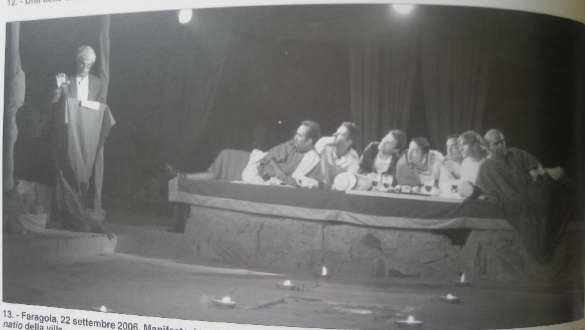
13. - Faragola, 22 settembre 2006. Manifestazione "La notte dei ricercatori": messa in scena dei Saturnalia di Macrobio nella cr natio della villa.