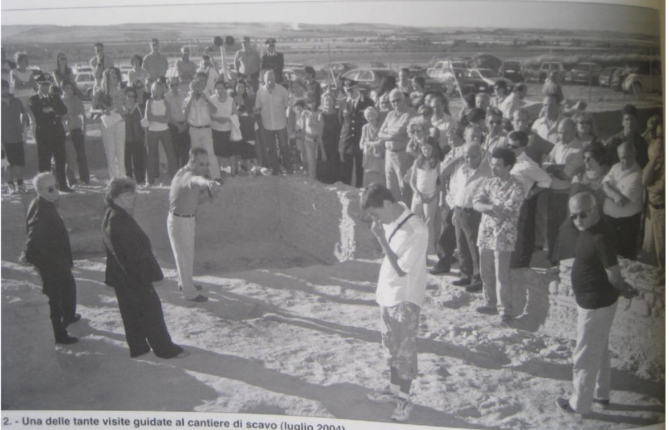
2. - Una delle tante visite guidate al cantiere di scavo (luglio 2004).

consistente in una visita guidata alla villa tardoantica e nella messa in scena di un banchetto aristocratico nella