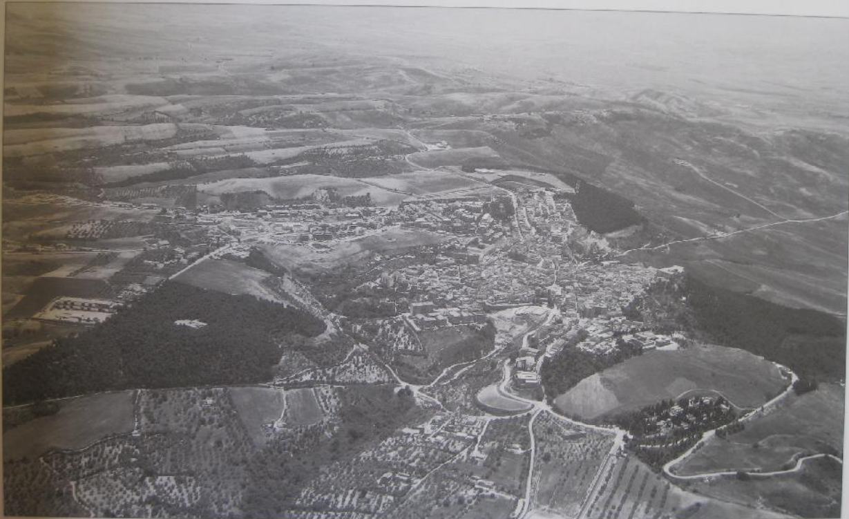
1. - Veduta aerea di Ascoli Satriano e della valle del Carapelle.

A tali obiettivi di carattere scientifico si aggiunge quello, non secondario, di produrre un'approfondita conoscenza delle 'potenzialità' archeologiche di un terri-