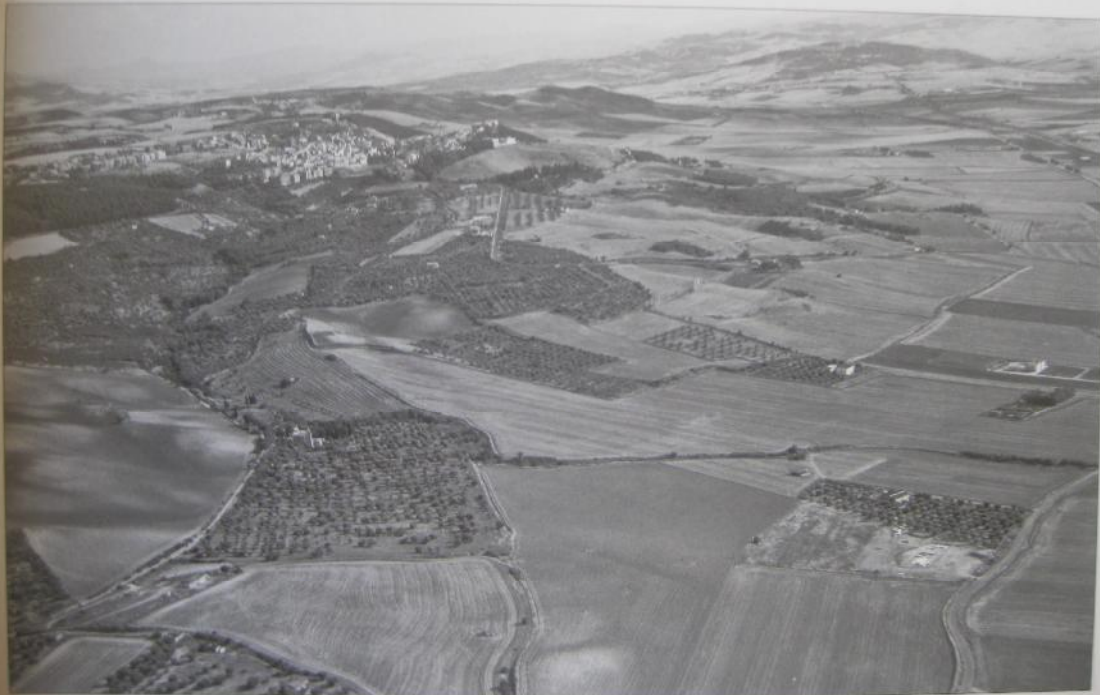
1. - Veduta della Valle del Carapelle: in basso a destra Faragola; in alto a sinistra Ascoli Satriano.